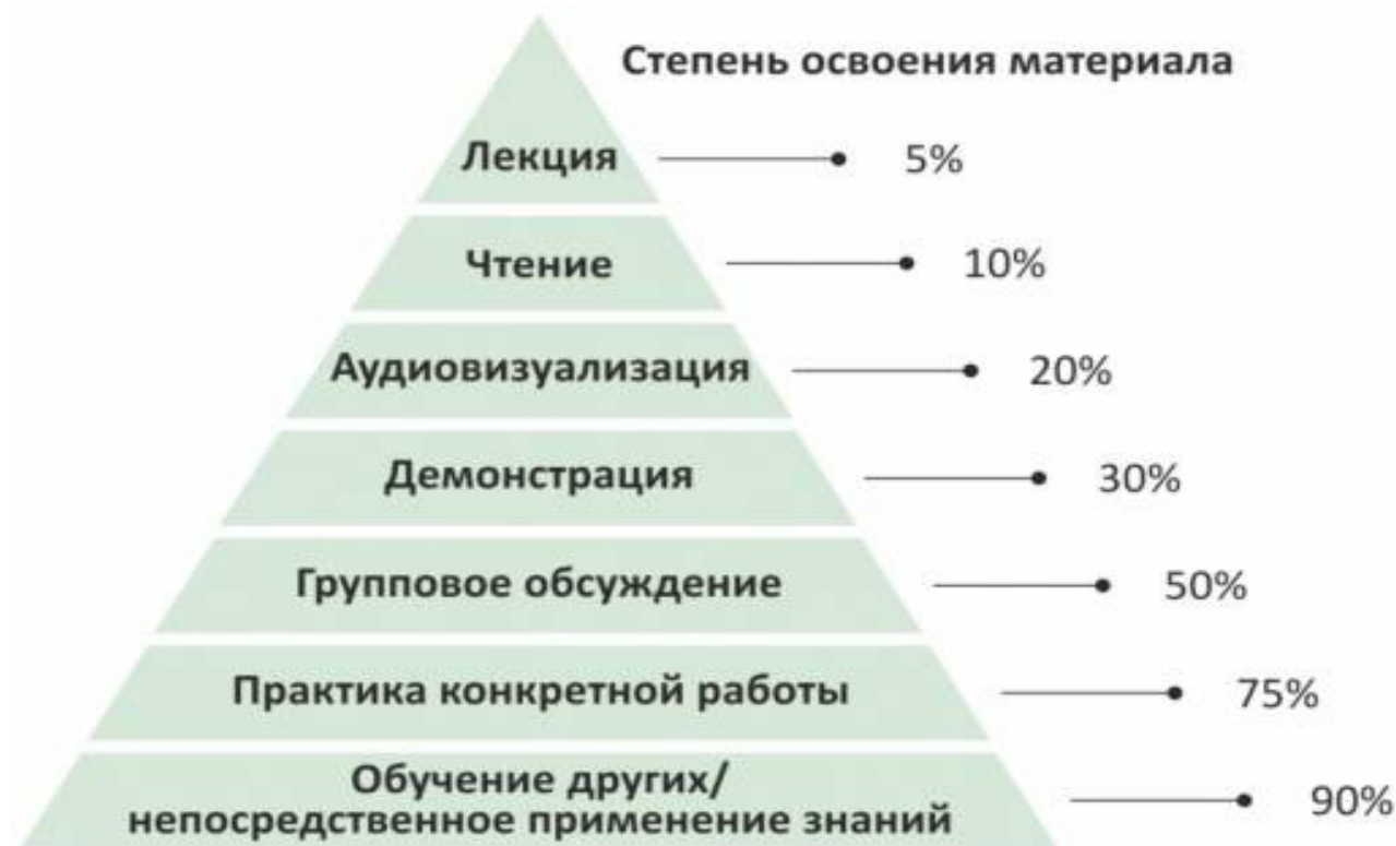
Рис. Схема степени освоения материала обучающимися