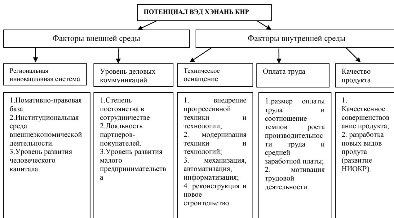
Рис. 2. Факторы, определяющие развитие внешнеэкономического потенциала провинции Хэнань КНР

К факторам внутренней среды следует отнести, прежде всего, низкий уровень инновационного потенциала системы (региональной инновационной системы). А к факторам внешней среды - нарастающую международную конкуренцию. Для оценки лояльности международных партнеров-покупателей предлагается система оценочных индикаторов (см. табл.4).