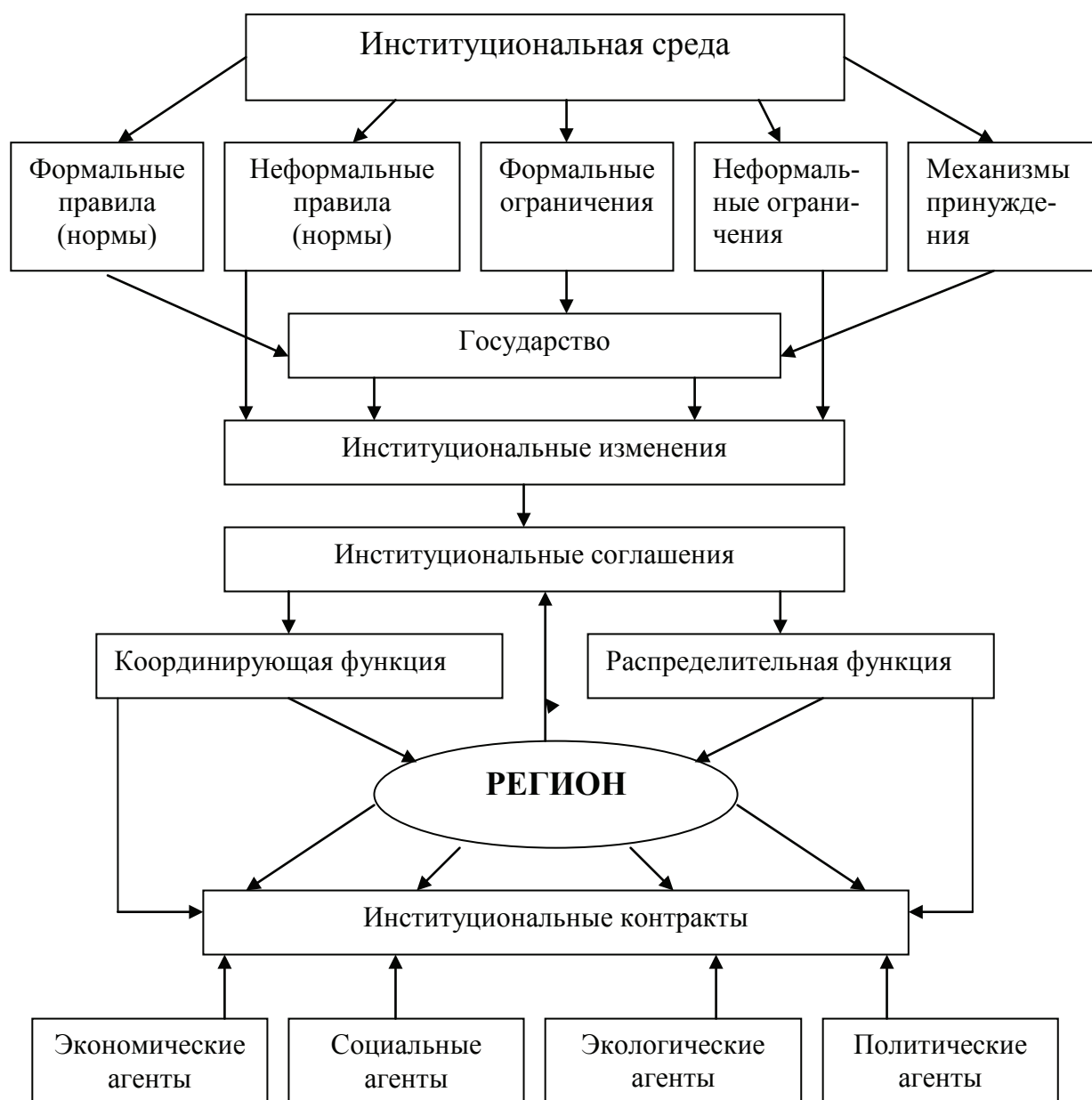
Рис. 2 Регион в институциональной среде

рый позволяет, как правило, идентифицировать несоответствие заявляемых целей с потенциалом системы. Разрешение таких противоречий невозможно без реализации системного свойства экономики – институциональности. Необходим процесс формирования правил взаимоотношений всех экономических субъектов в процессе поиска путей разрешения существующих противоречий, что предполагает, прежде всего, наличие четко сформулированных задач на уровне национальной экономики, для решения которых необходимо разработать и задействовать эффективные институциональные механизмы (рис.2).