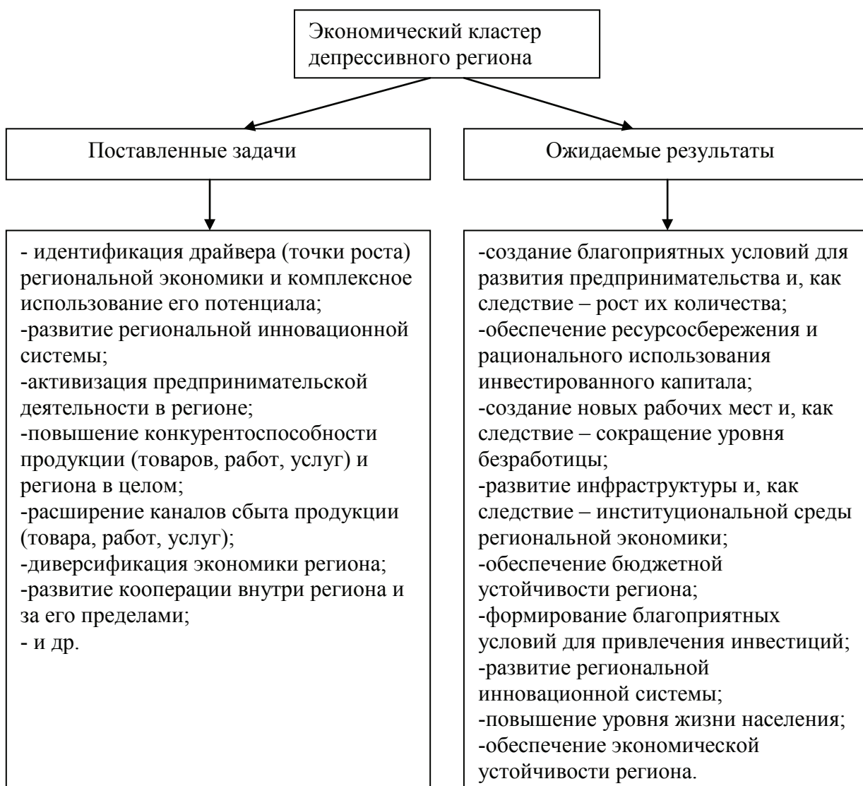
Рис. 3. Экономический кластер депрессивного региона, его задачи и ожидаемые результаты