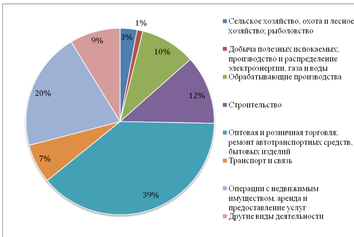
Рис. 2. Диаграмма отраслевой структуры малых предприятий

Перспективы развития малого предпринимательства зависят от многих факторов. В настоящее время предлагаются различные законопроекты, некоторые из которых препятствуют развитию МСП.