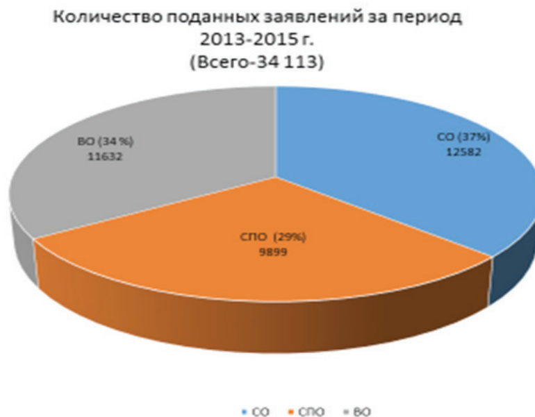
Рис. 2. Количество поданных заявлений за период 2013-2015 гг.